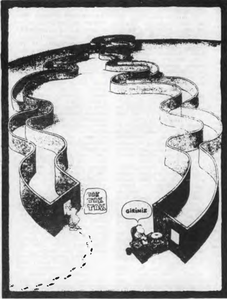
Oportünistler her işi böyle zorlaştırıyorlar

Balonu şişirdikçe içindeki hava da çoğalır! İşte ortacılığın durumu da böyle. Ettiği "devrimci" sözler büyüdükçe, dediklerinin kofluğu, boşluğu da artıyor.