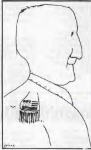
"Ordumuzun" Genel Kurmay Başkanı Kenan Evren

en güzel bir ifadesidir. En vezir bir biçimde dile getirilmiştir. Türk ordusunun Atatürkçü geleneğini sayın Evren gür sesle açıkça bir daha tüm dünyaya açıklamıştır... bilirsiniz ki sonunda mutlaka Atatürkçülük gene galip gelecektir. Ve Türkiye sıkıntılar çekecek, kuyruklarda bekleyecektir ama onuruna tekrar kavuşacaktır". Hürriyet gazetesi aynı gün sayfalarında iki "okuyucu" mektubuna yer verdi. Birinci mektubun başlığı "Atatürk tekrar doğmalı", ikincisinin ise "1981 yeni bir lider doğuracaktır".